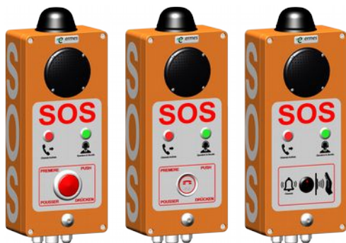
Pulsante a fungo rosso

Le due spie luminose, che indicano rispettivamente l'avvenuto inoltrato della chiamata e la presenza in ascolto dell'operatore, hanno la funzione di dare indicazioni sullo stato della chiamata alle persone ipovedenti in modo che possano facilmente rendersi conto di quando l'operatore è connesso in linea pronto a prestare attenzione alle loro parole anche se hanno difficoltà a sentirne la voce.